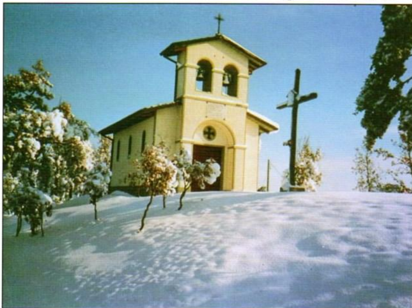
Una bella immagine della chiesetta alpina, Madonna delle Nevi, costruita sul Monte della Croce a Tolé, dai soci ivi residenti ed iscritti al Gruppo.

"Simpatia ed Amicizia" di Tolé, del Centro Sportivo Giovanile, del Centro per bambini orfani di guerra di Bugojno in Bosnia e dell'Ass. Naz. per lo studio e cura dei Tumori solidi (A.N.T.) di Bologna. Il 12 giugno 1985 Vergato ospita il Raduno Sezionale e nell'ambito della manifestazione si svolge un'altra significativa cerimonia: il raduno dei reduci del IX Battaglione Misto Genio per Corpo d'Armata Alpino. Questo Reparto fu costituito proprio a Vergato nel 1940 da dove partì per i vari fronti. È la sola unità organica alpina della nostra Regione.