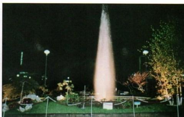
Particolare della fontana allestita nella Piazza centrale dal Gruppo.