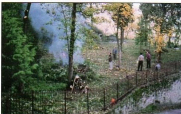
Una fase della pulizia da erbacce nel giardino adiacente la Sede.