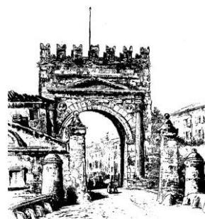
Arco di Augusto